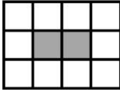
4 sloupce 3 řady